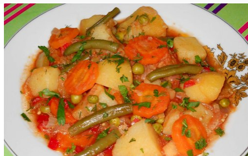
http://www.bucataras.ro/retete/ghiveci-de-legume-30737.html GHIVECI DE LEGUME