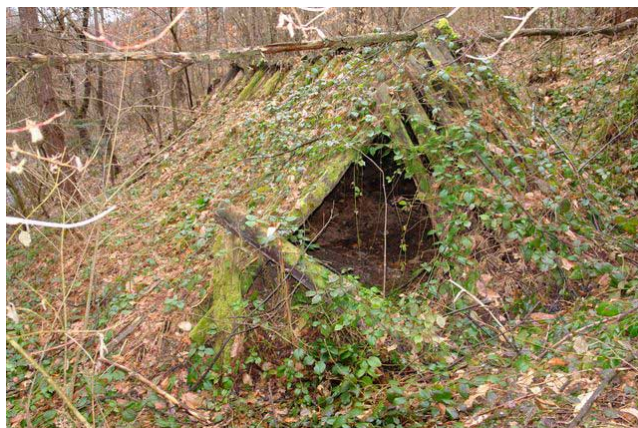
Bordei silvic (de pădure) tradițional pe valea Negruții