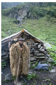
Munții Făgăraș. Bordei ciobănesc, locuință temporară

http://emilmihaisimionescu.wordpress.com/2010/08/09/prima-din-cele-o-mie-si-una-cioban/