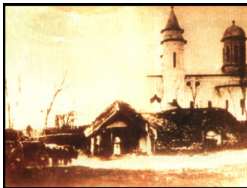
O fotografie foarte veche, din anii 1900: un bordei în fața Bisericii Sf. Nicolae, din orașul Corabia (jud. Olt, http://www.skyscrapercity.com/showthread.php?t=1557640&page=2 )

Din tc. güvec . (DEX online: http://dexonline.ro/ )