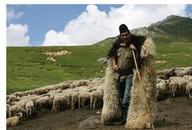
Cioban cu blugi și șubă

http://emilmihaisimionescu.wordpress.com/2010/08/09/prima-din-cele-o-mie-si-una-cioban/