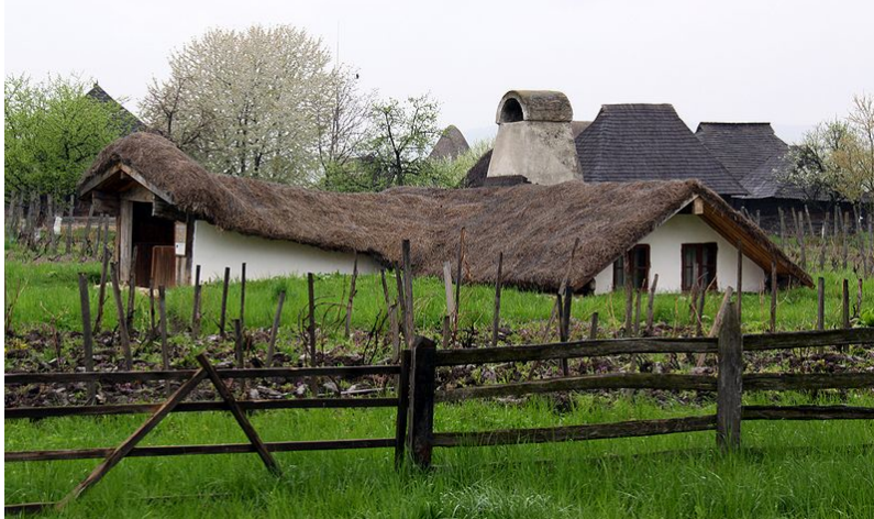
Bordei din Puțuri, Castranova, în Muzeul Viticulturii și Pomiculturii din Golești. gard, grădină de zarzavat