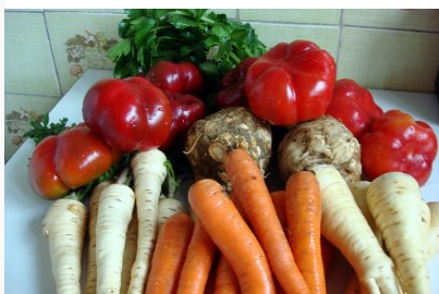
frunze, rădăcină de pătrunjel morcovi gogonele rădăcină de păstârnac țelină, frunze și rădăcină de țelină