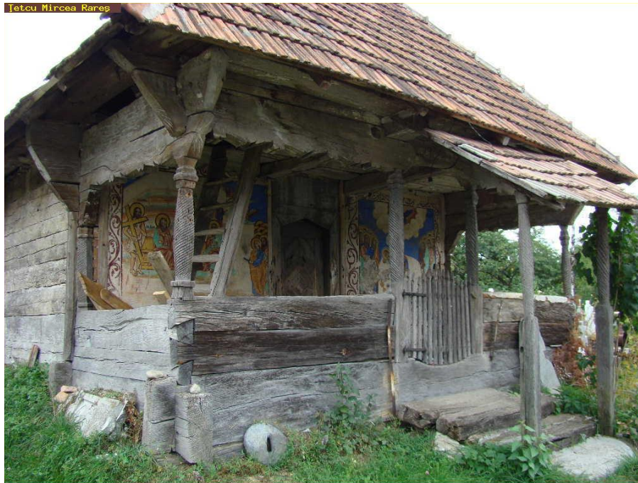
Biserică de lemn cu cerdac decorat/pictat

http://www.biserici.org/index.php?menu=BI&code=8511