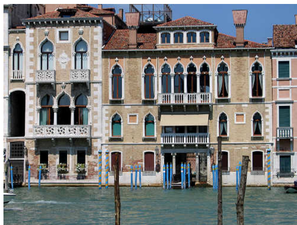
Fațada unui palat din Veneția, Italia.

Palatul Mogoșoaia (1702) este o clădire istorică din localitatea Mogoșoaia, aflată la circa 15 km de centrul orașului București . Palatul a fost construit până în 1702 de către Constantin Brâncoveanu în stil arhitectural românesc renașcentist sau stil brâncovenesc, o combinație de elemente venețiene cu elemente otomane.