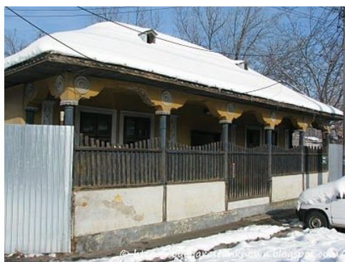
Casă construită în anul 1859, fotografie din 2011

http://www.bucurestifm.ro/vechile_case_cu_pridvor_din_bucuresti-11548