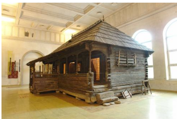
Casă tradițională de lemn cu cerdac la Muzeul Țăranului Român

http://www.muzeultaranuluiroman.ro/ http://ro.wikipedia.org/wiki/Muzeul_Țăranului_Român