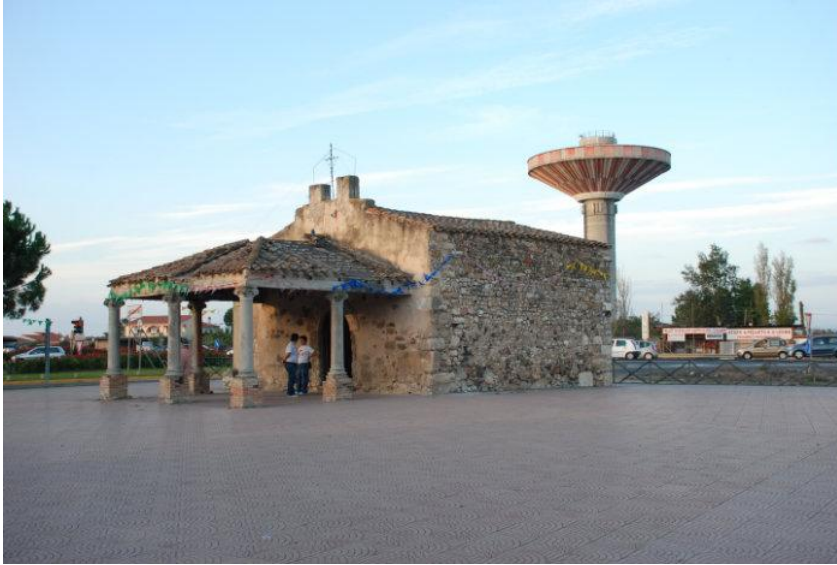
Bisericuță veche cu "lolla" = prispă, cerdac