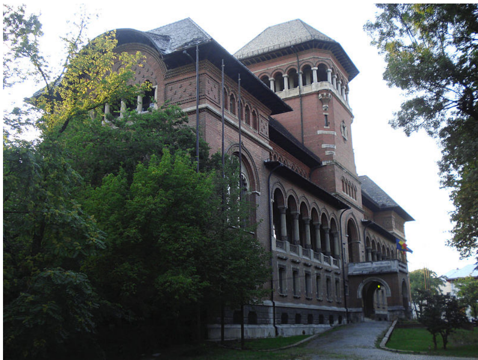
Muzeul Țăranului Român (1912-1941)

http://www.muzeultaranuluiroman.ro/ http://ro.wikipedia.org/wiki/Muzeul_Țăranului_Român