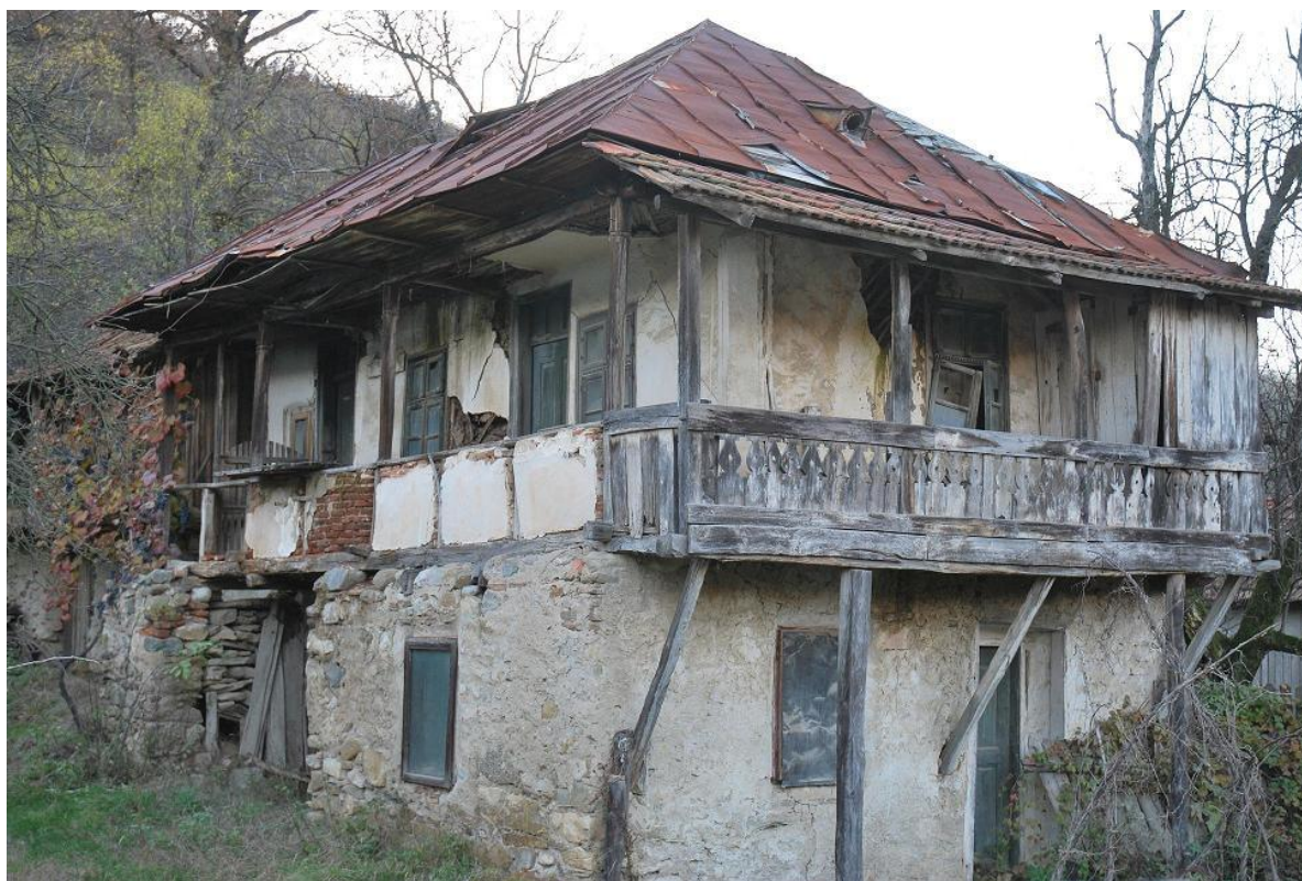
casă înaltă veche, abandonată / părăsită - fotografiată în anul 2009 (Dâlbocița) http://elvisdobrescu.wordpress.com/2009/11/25/o-fotografie-face-cat-o-mie-de-cuvinte-vii-3/casa-traditionala-sat-dalbocita-foto-elvis-dobrescu-2009-2/

Materiale: piatră cărămidă lemn tablă țiglă tencuială