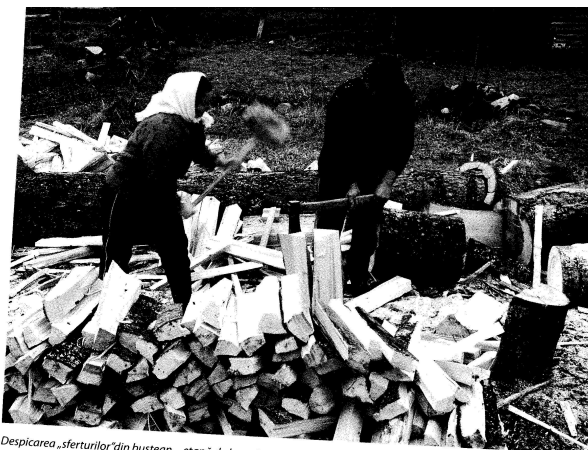
Despicarea „sferturilor” din buștean – etapă de lucru în pregătirea bucașilor de șindrilă pentru înveltoarea casei

(Ana Bărcă, Plastica arhitecturii rurale , București, Ad Libri, 2007, p. 42)