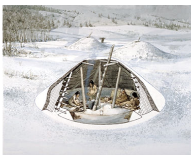
BORDEI CANADIAN

Bordei reconstituit, cultura Anasazi/Pueblo, secolele XI-XIII