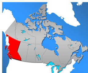
http://forums.france2.fr/france2/jeux/alphabet-debile-sujet_5294_437.htm Kekuli (Le kekuli est une maison semi-enterrée amérindienne. C'est la maison traditionnelle d'hiver de la tribu Little Shuswap de Colombie-Britannique.)