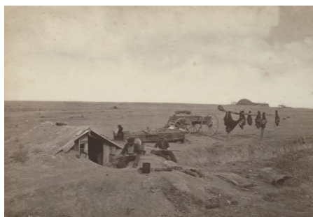
Bordei/ul vânătorilor de bizoni în America