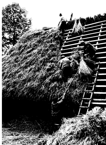
Așezarea snopilor de paie peste structura din lemn a acoperișului.

(Ana Bârcă, Plastica arhitecturii rurale , București, Ad Libri, 2007, p. 40)