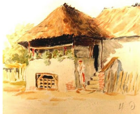
Horia Damian (1922-), Casă țărănească, acuarelă

http://byzantinearch.blogspot.it/2009/10/casa-taraneasca-cu-pridvor.html