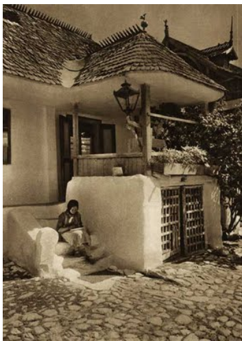
Casă cu foișor, Breaza, fotografie