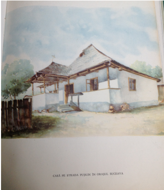
Casă cu foișor și cerdac