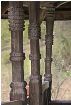
Stâlp cioplit 3 stâlpi ciopliți acoperiș de șindrilă