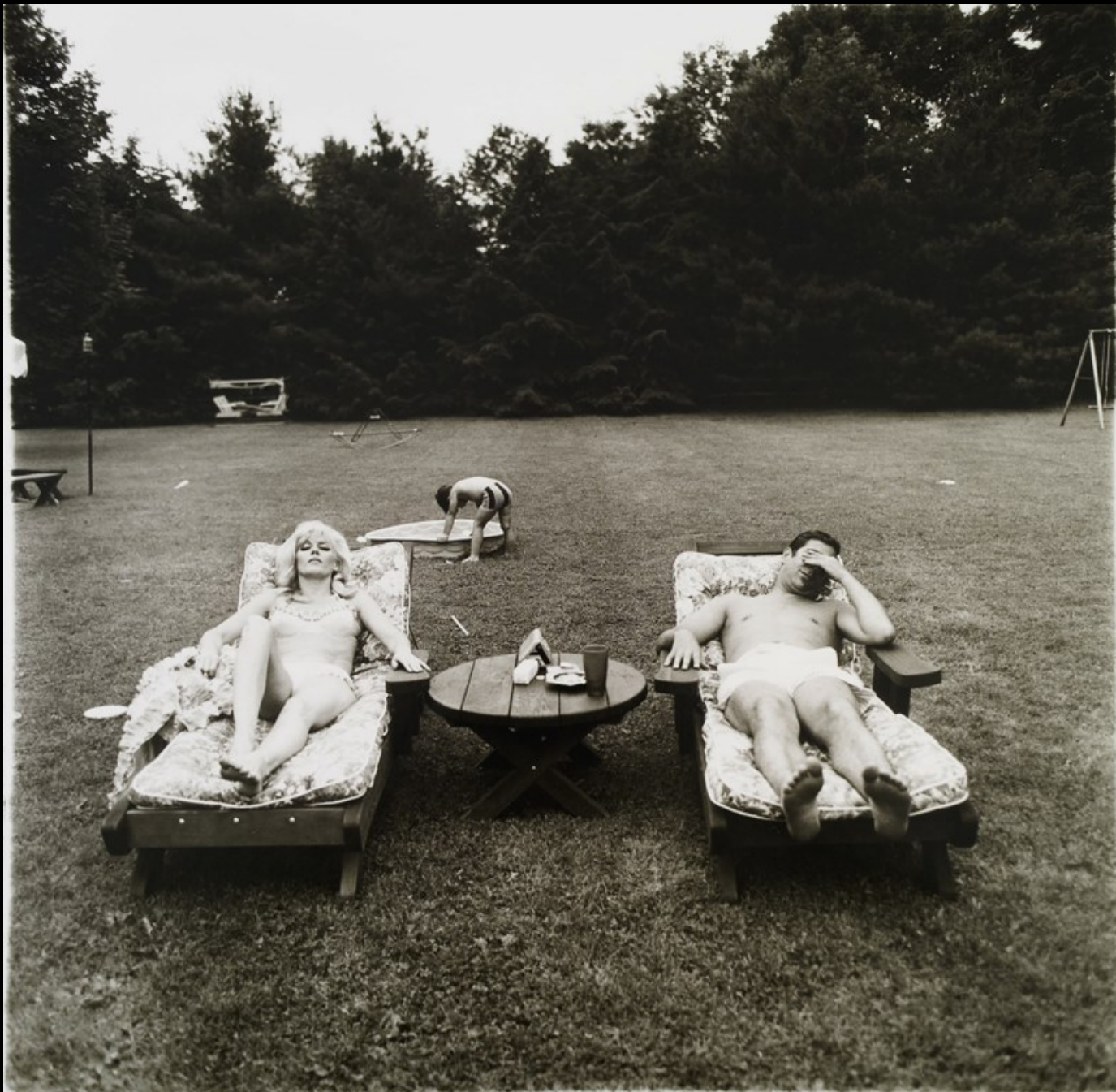
Diane Arbus, Famiglia sul prato di casa, una domenica e Westchester, New York, 1969