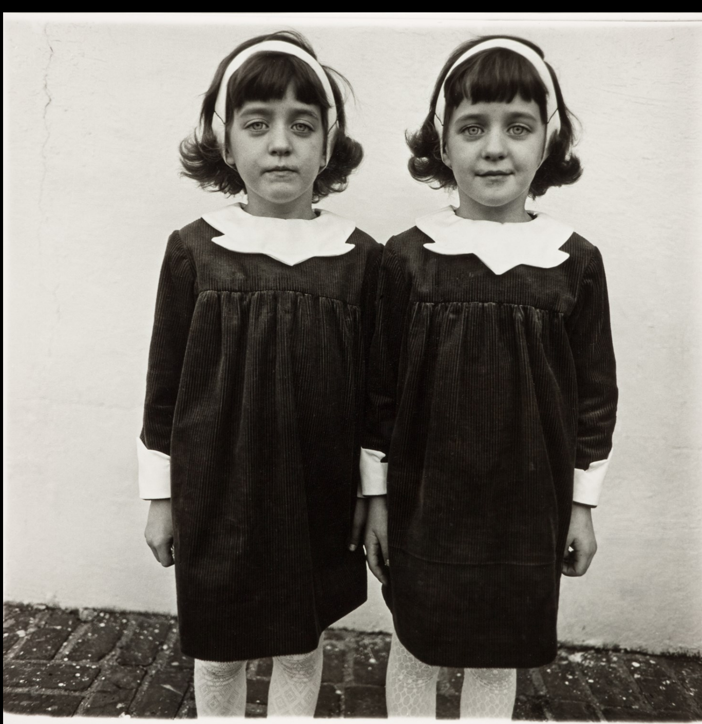
Diane Arbus, Gemelle identiche, Roselle (New Jersey), 1967, stampa alla gelatina - sale d'argento